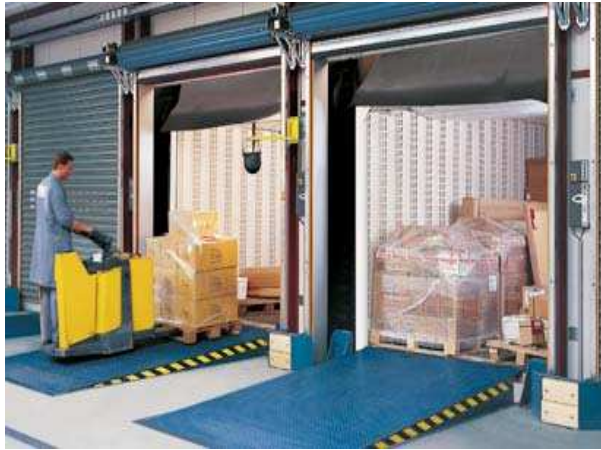
- Pedane per carico e scarico