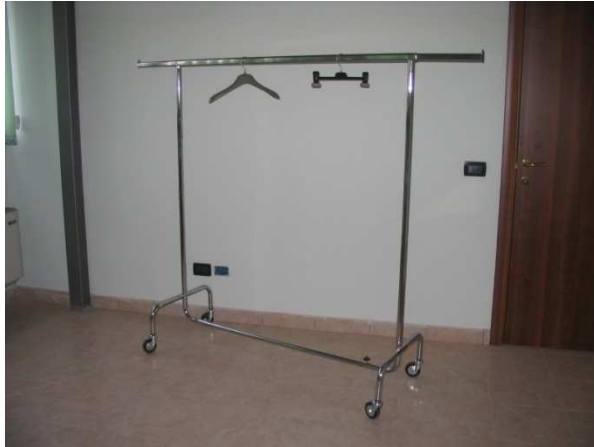
- Carrelli stand cromati per negozi