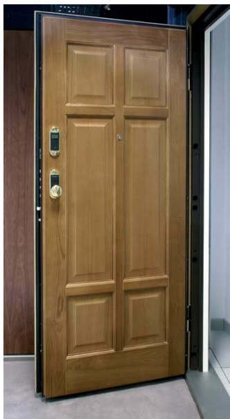
- Porte blindate