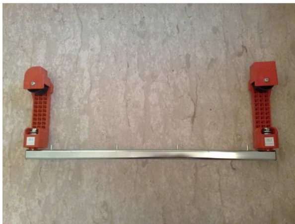
- Carrelli aerei, disponibili con 3 misure diverse, in base al vostro risalitore