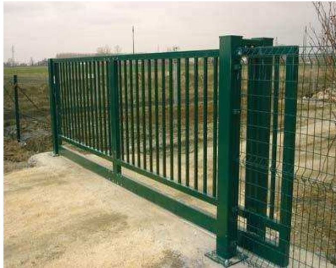
- Cancelli in ferro