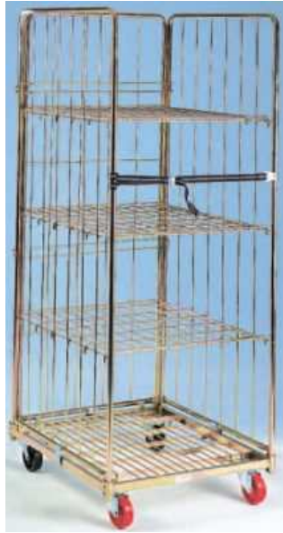
- Gabbie per capi stesi