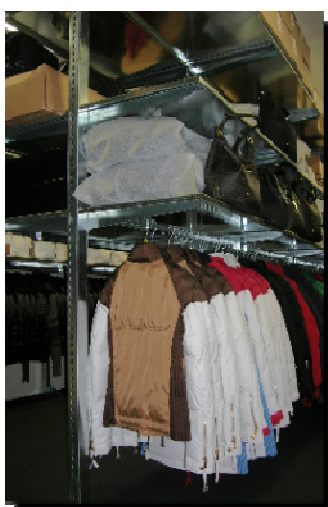
- Scaffalatura per negozi per capi appesi e stesi