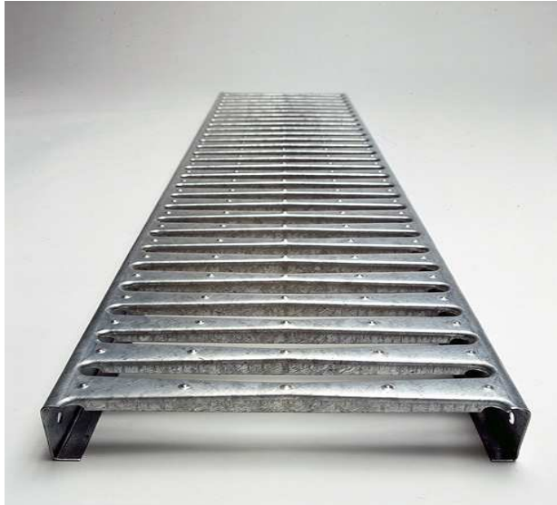
- Grigliato per soppalchi e scaffalature calpestabili