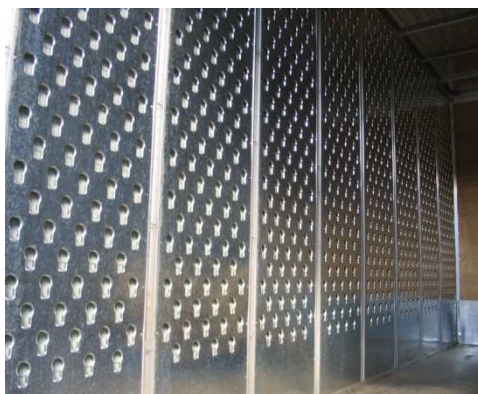
- Allestimento a nido d'ape di furgoni e/o bilici