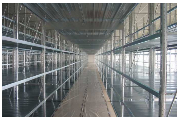
- Scaffalatura capi stesi