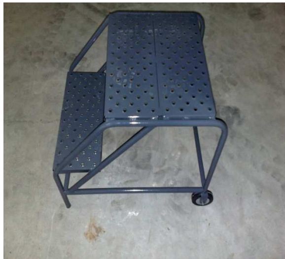
- Sgabelli a 2 e/o 3 scalini verniciati