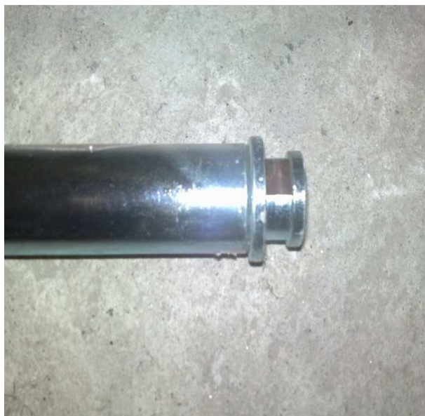
- Stanghe per capi appesi