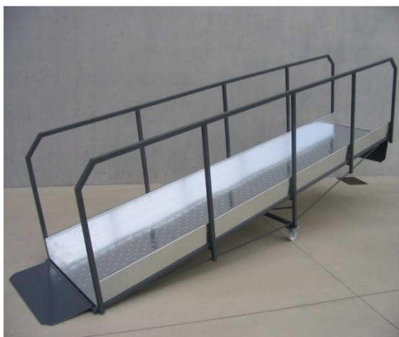
- Scivoli per carico e scarico carrelli stand