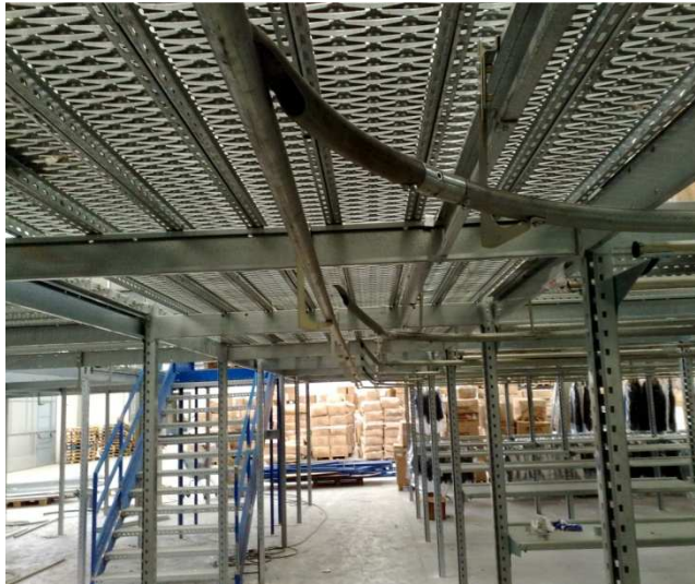
- Snodi semplici e/o completi in ferro per la movimentazione dei carrelli aerei negli impianti di capi appesi