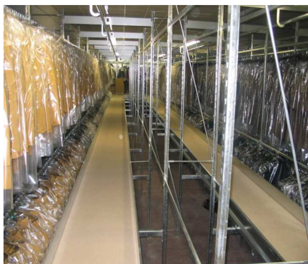
- Scaffalatura a passerella per capi appesi e stesi