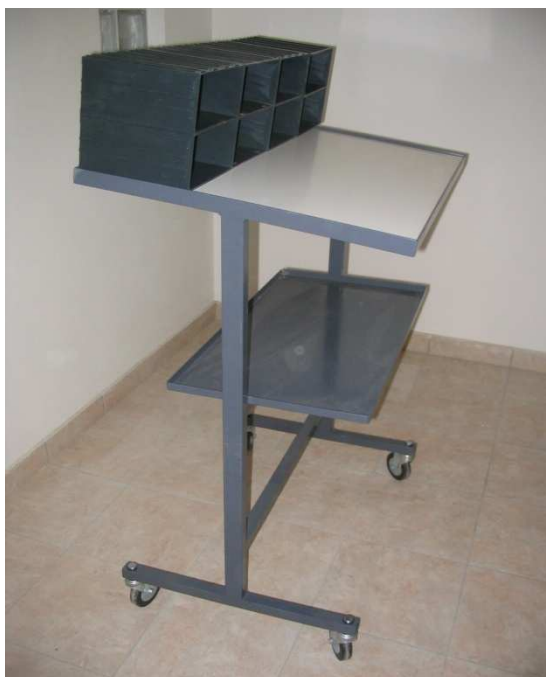
- Banchi da lavoro con o senza scomparti