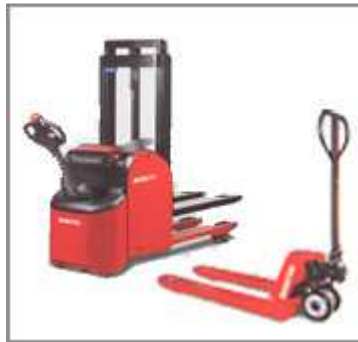
- Transpallets manuali ed elettrici